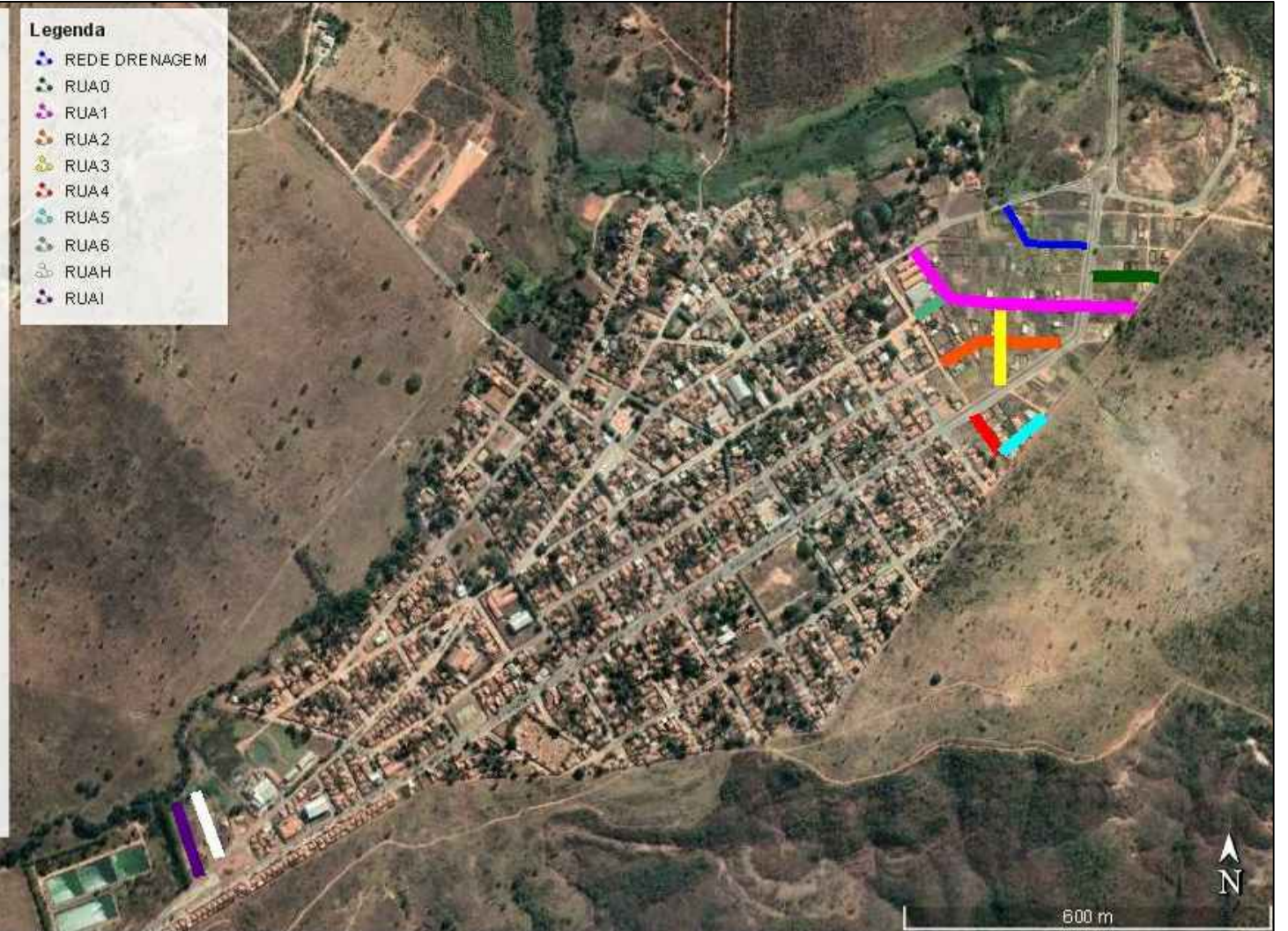
1 PLANTA DAS VIAS ESCALA 1:750