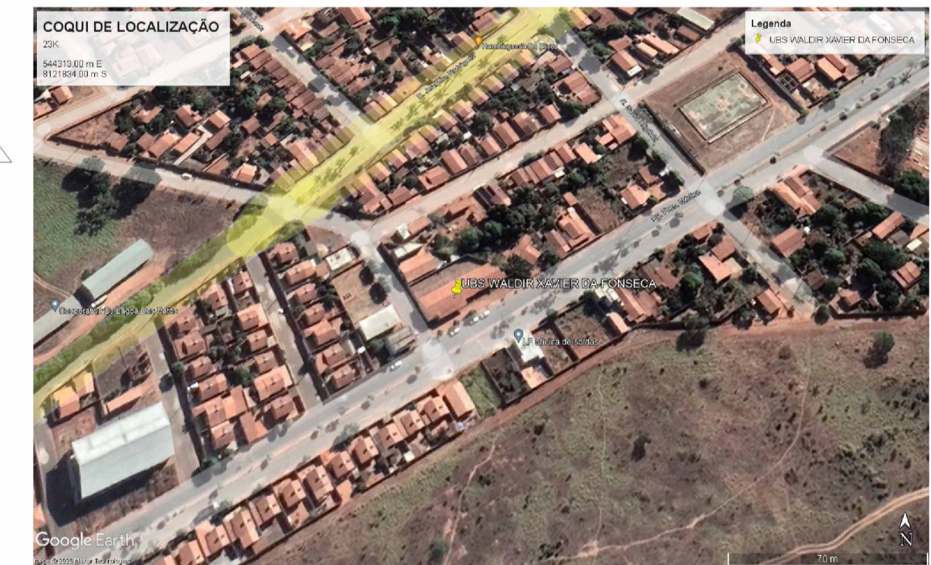
CROQUI DE LOCALIZAÇÃO ESC: 1 : 250