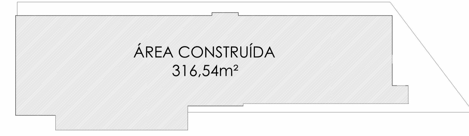
PLANTA DE ÁREA ESC: 1 : 200