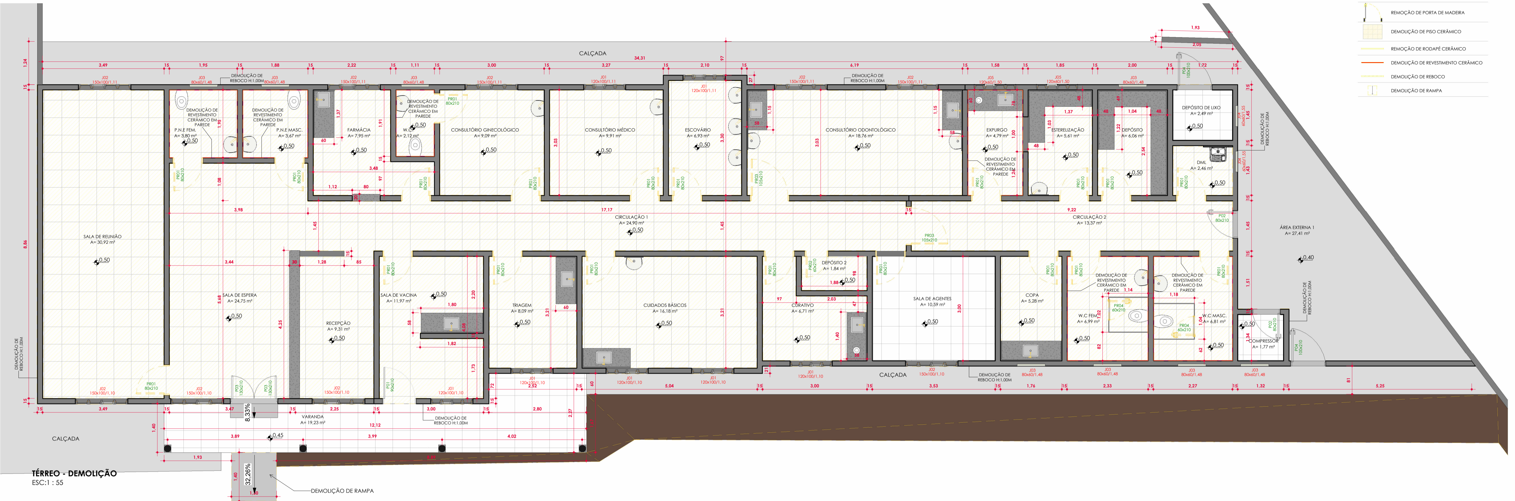
TÉRREO - DEMOLIÇÃO ESC:1 : 55